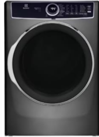
ELFG7637AT 600 Series Gas Dryer