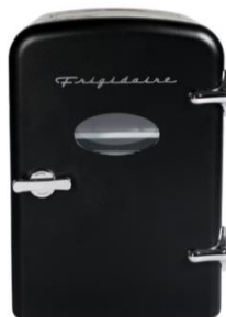
EFMIS129-BLACK Retro Mini Fridge