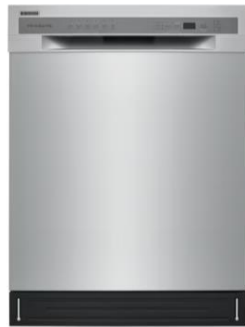
FFBD2420US Stainless Steel Dishwasher