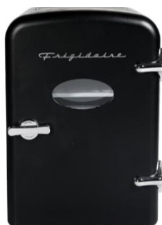
EFMIS129-BLACK Retro Mini Fridge